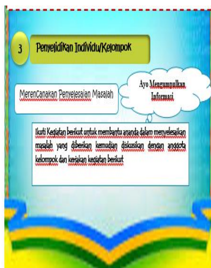
Gambar 4. Fase 3 PBL

Pada fase 3 PBL, siswa mengumpulkan data dan membuat rencana penyelesaian masalah melalui kegiatan “Ayo mengumpulkan informasi”, menjalankan rencana penyelesaian masalah, memeriksa selesaian masalah. Rancangan fase 3 diperlihatkan pada Gambar 4 dan Gambar 5.