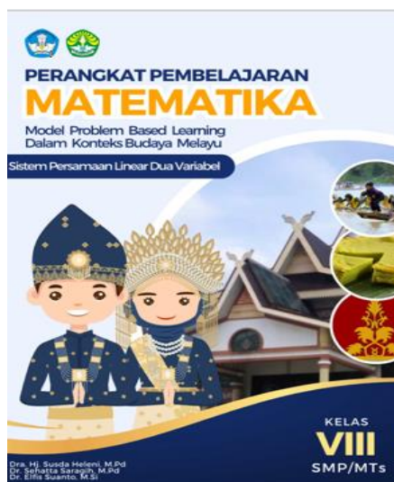
Gambar 7. Sampul buku

Hasil rancangan LKPD untuk 5 kali pertemuan disusun dalam sebuah buku. Tampilan buku disajikan pada Gambar 7.