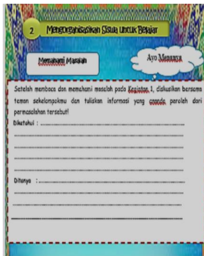
Gambar 3. Rancangan Fase 2 PBL

DOI: https://doi.org/10.24127/ajpm.v14i1.9038