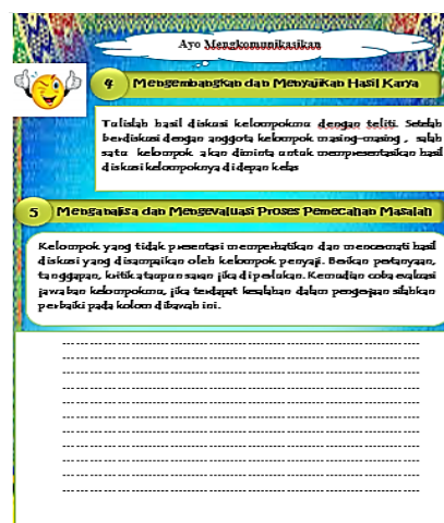
Gambar 6. Fase 4 & 5 PBL

Pada fase terakhir dari PBL yaitu fase 5 disajikan ruang pengisian berupa saran atau masukan dari kelompok penyaji maupun kelompok lain. Rancangan fase 4 dan 5 disajikan pada Gambar 6.