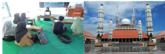
Gambar 2. Siswa mengamati video Masjid Agung Jawa Tengah (MAJT)

Sebelumnya, siswa telah dibentuk kelompok untuk menyelesaikan LAS 1. Dengan menggunakan konteks Masjid Agung Jawa Tengah (MAJT) siswa dapat dengan mudah mensketsakan bentuk MAJT yang berbentuk limas, mengidentifikasi, dan menentukan sifat-sifat limas. Dalam mendiskusikan LAS 1 siswa terlihat begitu aktif. Setelah selesai berdiskusi dan menyelesaikan LAS 1 guru meminta salah satu kelompok untuk mempresentasikan jawabannya. Selain itu guru juga memberikan kesempatan kepada siswa lain untuk mengemukakan pendapat terkait jawaban yang tidak sama atau belum dipahami dengan menyertakan alasannya. Berikut hasil jawaban siswa pada LAS 1 dapat dilihat pada gambar 3.