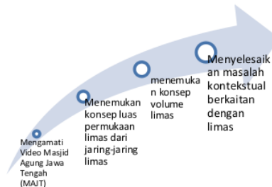
Gambar 1. Lintasan aktivitas pembelajaran limas

sifat limas. Gambar 2 menunjukkan aktivitas siswa pada saat mengamati video Masjid Agung Jawa Tengah.