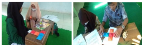
Gambar 7. Aktivitas siswa untuk menemukan konsep volume bangun ruang sisi datar.

Pada aktivitas ini awalnya siswa mengalami kesulitan dalam menemukan konsep volume limas. Oleh karena itu peneliti atau guru memberikan pertanyaan akan mengarahkan siswa untuk menemukan konsep volume limas. Berdasarkan kubus berongga limas tersebutlah siswa dapat menganalisis volume limas dengan membandingkan volume kubus dengan volume 6 limas, karena dalam sebuah kubus itu terdapat 6 buah limas. Pada gambar 7 terlihat aktivitas yang dilakukan siswa untuk dapat memperoleh rumus volume bangun ruang sisi datar.