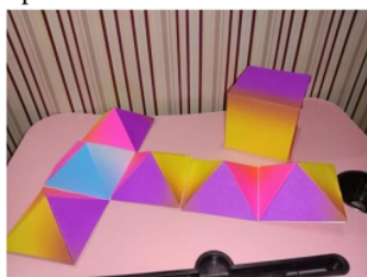
Gambar 6. Kubus Berongga limas

Kemudian langkah selanjutnya adalah siswa memasang jaring-jaring limas tersebut pada jaring-jaring kubus. Sehingga terbentuklah bangun ruang kubus berongga limas. Bangun ruang kubus berongga limas dapat dilihat pada gambar 6. Dengan berbantu kubus berongga limas siswa dapat menemukan konsep volume limas.