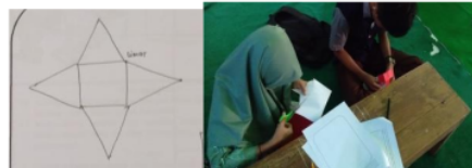
Gambar 4. Hasil Jawaban dan kegiatan siswa pada LAS 2

Berdasarkan pengalaman diaktivitas sebelumnya, pada aktivitas ini siswa dengan mudah membuat jaring-jaring limas kemudian menggambarannya. Berikut hasil jawaban siswa pada aktivitas 2 dapat dilihat pada gambar 4.