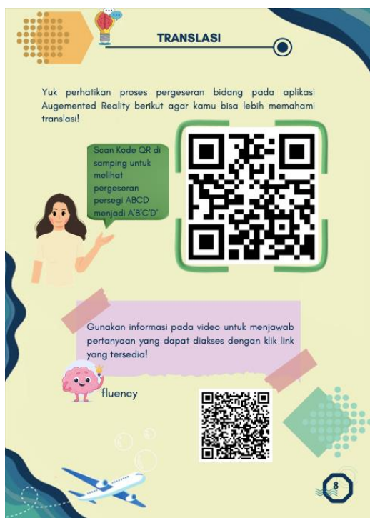
Gambar 2. Kode QR untuk mengakses Augmented Reality

DOI: https://doi.org/10.24127/ajpm.v13i3.8786