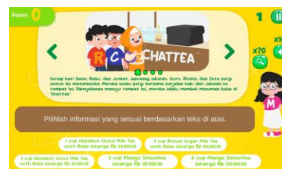
Gambar 5. Tampilan butir soal pada game