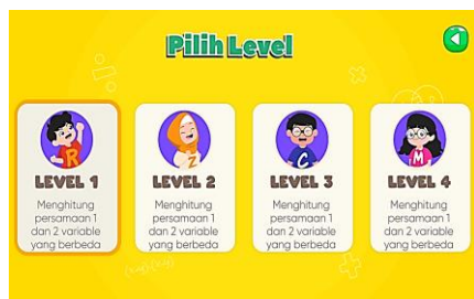
Gambar 2. Pelevelan pada game