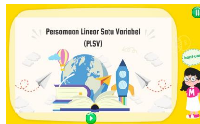
Gambar 4. Video Pembelajaran dalam level 2