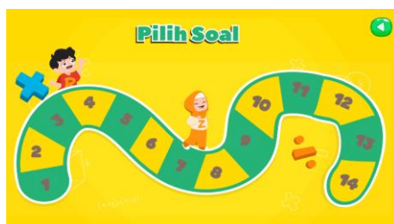
Gambar 3. Tampilan butir soal pada setiap level