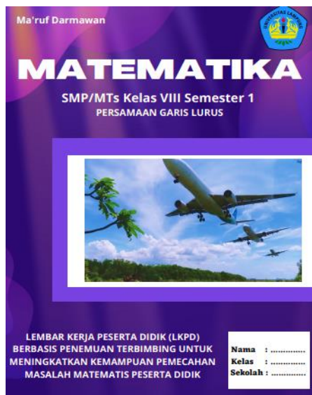
Gambar 1. Cover LKPD

Berdasarkan masalah yang ditemui pada tahap studi pendahuluan, dikembangkan LKPD berbasis penemuan terbimbing untuk meningkatkan kemampuan pemecahan masalah. LKPD ini memuat sekumpulan materi dan kegiatan yang harus dipelajari oleh peserta didik untuk memaksimalkan pemahaman dalam upaya pembentukan kemampuan dasar berdasarkan indikator pencapaian hasil belajar. Adapun hasil dari desain LKPD dapat dilihat pada Gambar 1, 2, dan 3.