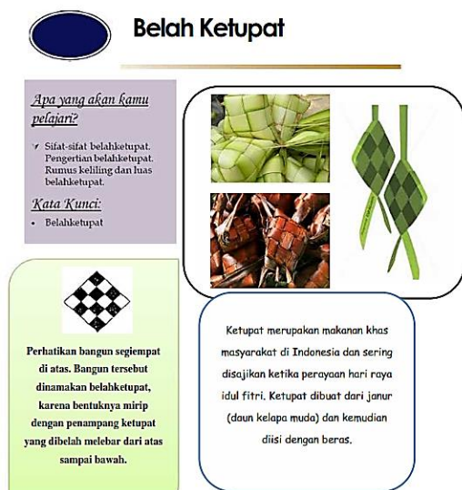
Gambar 2. Halaman depan bahan ajar

untuk materi bangun datar disajikan dalam bentuk gambar bangunan rumah adat atau benda lain yang sesuai dengan kearifan lokal di suku sunda. Adapun contoh desainnya dapat dilihat pada Gambar 2.