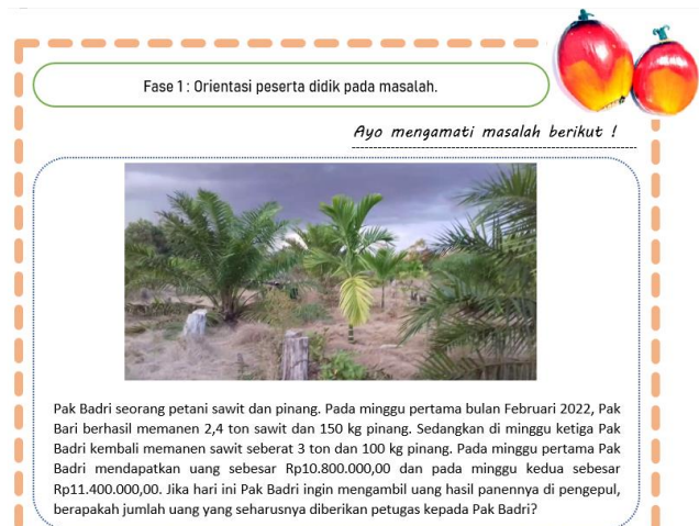
Gambar 3. Masalah pada LKPD-1

Setelah penyusunan produk awal selesai, kemudian dilakukan kegiatan