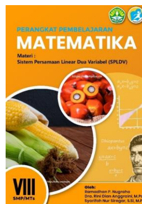
Gambar 6. Cover perangkat

mengantarkannya ke sekolah tempat peneliti melakukan penelitian ini.