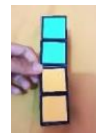
(b.) Sisi samping