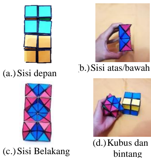
Gambar 4. Bagian dalam Origaruen (2) dan bintang Origaruen

Gambar 3 menunjukkan bagian dalam media Origaruen apabila dibuka dengan cara satu. Siswa diarahkan untuk mengamati dan menentukan bagian sisi kubus yang saling kongruen dan tidak kongruen apabila bangun tersebut dirotasikan dan dilipat. Hal tersebut bertujuan melatih kecerdasan spasial berupa mentransformasi dan mempersepsi perubahan bentuk bangun apabila ditransformasikan dan diamati dari sudut pandang seperti pada Gambar 4.