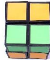
Gambar 2. Kubus Origaruen

Produk pengembangan juga dikembangkan berdasarkan indikator kecerdasan spasial. Berikut adalah hasil pengembangan dari media Origaruen yang mewakili indikator kecerdasan spasial.