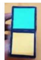
(d.) Sisi atas/bawah