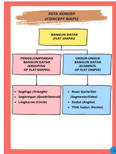
Gambar 6. Peta Konsep