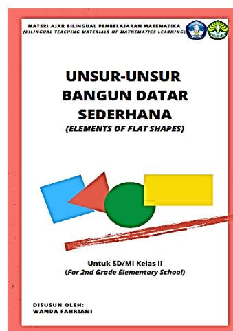
Gambar 2. Halaman sampul depan

Pembuatan halaman sampul depan menggunakan aplikasi Canva. Desain sampul depan terdiri dari judul, materi yang akan dipelajari, kelas, nama penulis, dan latar belakang yang sesuai dengan tema materi ajar. Desain halaman sampul depan dapat dilihat pada Gambar 2.