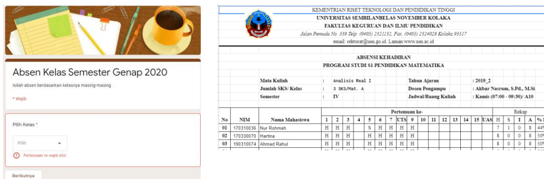
Gambar 2. Tampilan Absen Online dan hasil Rekap Absen

DOI: https://doi.org/10.24127/ajpm.v11i1.4725