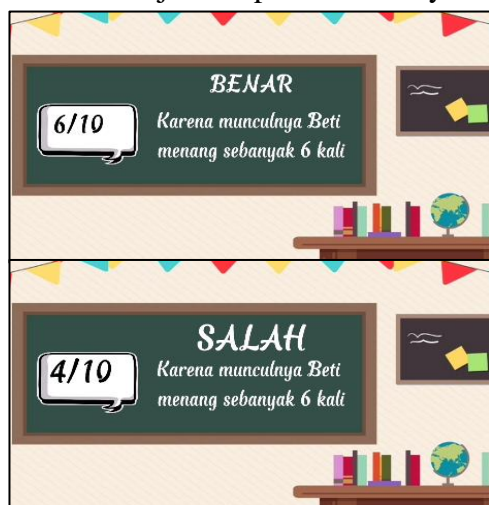
Gambar 12. Pembahasan Jawaban Benar dan Salah

Pada Gambar 11 ditampilkan dua pilihan jawaban, masing-masing jawaban ditunjukkan pembahasannya.