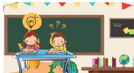
Gambar 8. Waktu Berpikir Siswa

Pada Gambar 8 disajikan sebelum rumus ditunjukkan, siswa diberi kesempatan beberapa detik oleh pengembang untuk memikirkan rumus yang diperoleh, berdasarkan hasil penyelesaian peluang empirik terjadinya hujan atau cerah dalam tujuh hari.