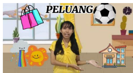
Gambar 2. Tampilan Manfaat Belajar Peluang

Disajikan pada Gambar 2 mengenai manfaat belajar peluang yang disampaikan dengan memunculkan gambar-gambar terkait agar mudah dipahami siswa.