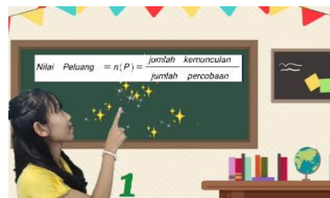
Gambar 9. Rumus Peluang Empirik

Pada Gambar 8 disajikan sebelum rumus ditunjukkan, siswa diberi kesempatan beberapa detik oleh pengembang untuk memikirkan rumus yang diperoleh, berdasarkan hasil penyelesaian peluang empirik terjadinya hujan atau cerah dalam tujuh hari.