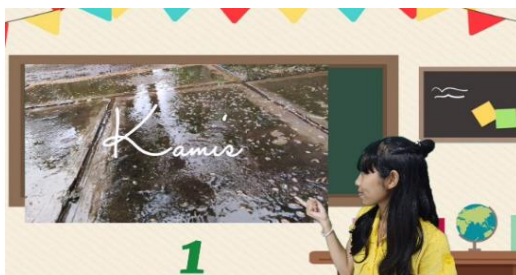
Gambar 6. Pengamatan Cuaca Hujan

Disajikan pada Gambar 5 salah satu cuplikan pengamatan pada hari Senin dengan cuaca cerah dari tujuh hari yang ditampilkan untuk diamati cuacanya oleh siswa.