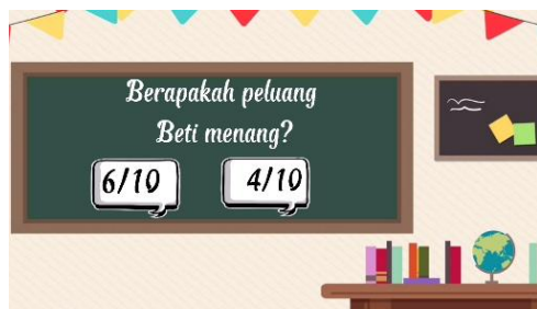
Gambar 11. Pilihan Jawaban

Pada Gambar 9, setelah diberi waktu beberapa detik, rumus ditampilkan dengan tampilan yang mudah dipahami. Pada Gambar 10 disajikan dua orang anak yaitu Beta dan Beti sedang bermain catur sebanyak sepuluh kali. Diberikan permasalahan berupa menentukan peluang menangnya Beti.