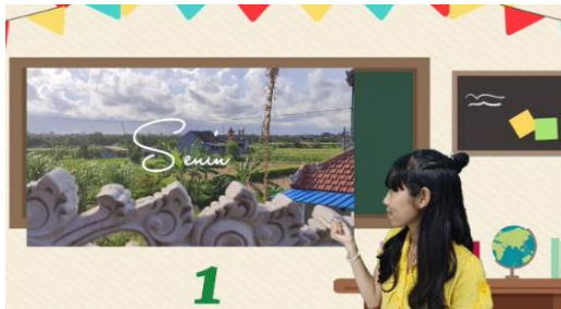
Gambar 5. Pengamatan Cuaca Cerah

Disajikan pada Gambar 5 salah satu cuplikan pengamatan pada hari Senin dengan cuaca cerah dari tujuh hari yang ditampilkan untuk diamati cuacanya oleh siswa.