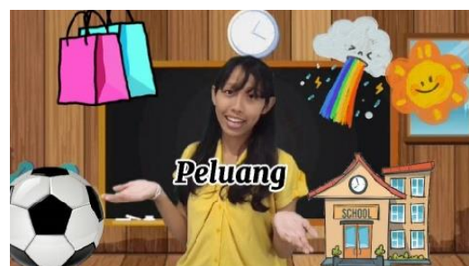
Gambar 1. Tampilan Awal Video

Video yang dikembangkan berupa data dengan format MP4 (.mp4) yang dapat diperoleh dengan mengunduh dan menyimpannya atau dapat dibagikan melalui Bluetooth atau aplikasi berbagi file lainnya. Video yang dihasilkan membutuhkan kapasitas kurang dari 50 MB dan diputar tanpa menggunakan jaringan internet atau secara offline . Video dapat dimanfaatkan saat proses pembelajaran daring maupun luring. Sebab dalam pemutarannya tidak membutuhkan akses yang sulit. Pembelajaran daring memanfaatkan ponsel yang dapat menyimpan dan memutar video. Sedangkan pembelajaran luring memanfaatkan sebuah LCD, laptop, dan pengeras suara. Berikut beberapa tampilan video yang telah disajikan pada gambar 1. Disajikan pada Gambar 1 tampilan awal video pembelajaran interaktif memuat gambar-gambar yang berhubungan dengan materi peluang yang dibahas pada isi video yang dikembangkan, sekaligus memancing siswa untuk mengaitkan hubungan gambar-gambar tersebut dengan materi peluang.