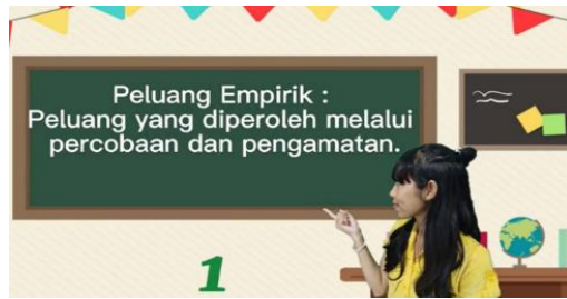
Gambar 4. Materi Peluang Empirik

DOI: https://doi.org/10.24127/ajpm.v11i1.4345