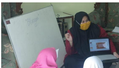
Gambar 1. Visual activities saat pembelajaran

Aktivitas ini meliputi memperhatikan guru dan teman, membaca materi pada proses pembelajaran. Visual activities mendapat persentase sebesar 100% pada pertemuan pertama dan kedua artinya semua kelompok memenuhi indikator yang ada di lembar observasi, pertemuan ketiga mendapat persentase sebesar 83,33% artinya ada beberapa siswa yang tidak memenuhi indikator di visual activities namun sebagian besar lainnya memenuhi. Dari pertemuan pertama, kedua persentasenya stabil sebesar 100% dan mengalami penurunan sebesar 16,67% di pertemuan ketiga. Salah satu contoh visual activities yang terjadi saat pembelajaran berlangsung, yakni memperhatikan guru dan membaca materi di dalam catatan mereka. Salah satu bentuk visual activities disajikan pada Gambar 1.