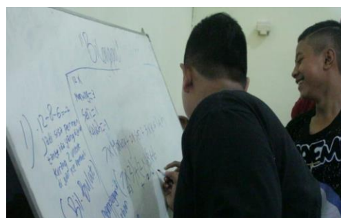
Gambar 8. Emotional activities saat pembelajaran

Aktivitas ini meliputi memiliki rasa berani, antusias, semangat, senang, peduli, dan tidak gugup pada proses pembelajaran. Emotional activities mendapat persentase sebesar 83,33% pada pertemuan pertama dan ketiga, dan pertemuan kedua mendapat persentase sebesar 100%. Dari pertemuan pertama persentasenya 83,33% mengalami peningkatan pada pertemuan kedua sebesar 16,67% dan mengalami penurunan pada pertemuan ketiga sebesar 16,67% juga. Salah satu contoh emotional activities yang terjadi saat pembelajaran berlangsung, yakni berani untuk menjawab pertanyaan guru dan senang saat antar siswa peduli untuk bekerjasama menjawab soal dengan senang dan semangat. Emotional activities , salah satunya ditunjukkan oleh Gambar 8.