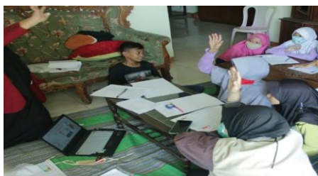
Gambar 2. Oral activities saat pembelajaran

DOI: https://doi.org/10.24127/ajpm.v10i2.3559