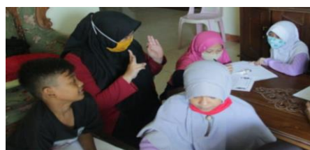
Gambar 3. Listening activities saat pembelajaran

pertemuan pertama, kedua persentasenya stabil sebesar 100% dan mengalami penurunan sebesar 16,67% di pertemuan ketiga. Salah satu contoh listening activities yang terjadi saat pembelajaran berlangsung, yakni mendengarkan penjelasan guru. Salah satu listening activities ditunjukkan oleh Gambar 3.