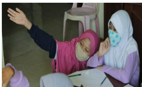
Gambar 7. Mental activities saat pembelajaran

mendapat persentase sebesar 83,33%. Dari pertemuan pertama persentasenya 66,67% mengalami peningkatan pada pertemuan kedua sebesar 33,33% dan mengalami penurunan pada pertemuan ketiga sebesar 16,67%. Salah satu contoh mental activities yang terjadi saat pembelajaran berlangsung, yakni untuk memecahkan soal yang ada di LKK dan membuat keputusan bersama di akhir pembelajaran. Salah satu aktivitas mental disajikan pada Gambar 7.