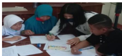
Gambar 6. Motor activities saat pembelajaran

Berdasarkan hasil analisis pada tabel 2 dapat dilihat bahwa terdapat siswa yang memenuhi indikator pada motor activities , yakni menemukan jawaban dan berdiskusi pada proses pembelajaran. motor activities mendapat persentase sebesar 83,33% pada pertemuan pertama, kedua, dan ketiga artinya ada beberapa siswa yang tidak memenuhi indikator di motor activities namun sebagian besar lainnya memenuhi. Dari pertemuan pertama, kedua, dan ketiga persentasenya stabil sebesar 83,33%. Salah satu contoh motor activities yang terjadi saat pembelajaran berlangsung, yakni berdiskusi dengan kelompoknya dan tiap kelompok menemukan jawaban. Salah satu bentuk motor activities ditunjukkan oleh Gambar 6.