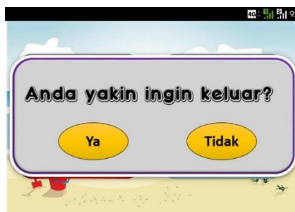
Gambar 4. Tampilan Menu Kecil

Tombol keluar berfungsi untuk keluar dari aplikasi. Setelah tombol keluar ditekan akan muncul menu kecil. Menu ini dapat dilihat pada Gambar 4.