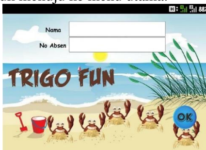
Gambar 1. Tampilan Halaman Awal

berbagi gambar pada game dibuat menggunakan Coreldraw 2017 , sedangkan materi dan pilihan jawaban dibuat menggunakan Microsoft Office Power Point 2016 . Halaman pembuka memiliki tampilan yang dapat dilihat pada Gambar 1. Pada halaman ini pemain diminta untuk mengisi identitas diri, setelah itu menekan tombol “OK” yang berada pada ujung kanan bawah untuk menuju ke menu utama.