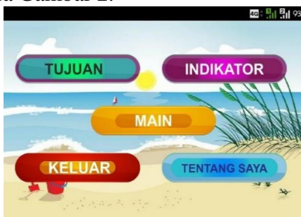
Gambar 2. Tampilan Menu Utama

Setelah menekan tombol “OK” maka akan tampil menu utama pada game edukasi ini. Tampilan ini berisi 5 menu utama yaitu indikator, tujuan, tentang saya, main, dan keluar. Tampilan menu utama dapat dilihat pada Gambar 2.