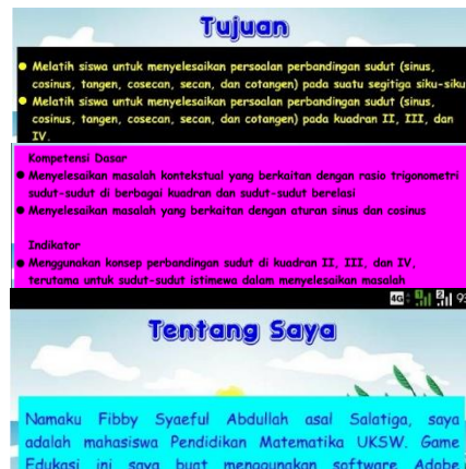
Gambar 3. Tampilan Halaman Tujuan, Indikator dan tentang saya

Tampilan halaman tujuan, indikator dan tentang saya dapat dilihat pada Gambar 3. Halaman Tujuan, Indikator, dan Tentang Saya masing memiliki tombol kembali yang berbentuk panah melengkung. Apabila ditekan akan kembali ke menu utama.