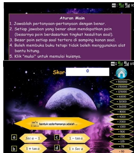
Gambar 7. Tampilan Kuis Trigo dan Aturan Mainnya

Aturan main Kuis Trigo berbeda dengan aturan main Game Bingo. Aturan main dan tampilan Kuis Trigo dapat dilihat pada Gambar 7. Tampilan Game Bingo dan Kuis Trigo mempunyai beberapa tombol yang mempunyai fungsi masing-masing. Bentuk tombol-tombol ini dibuat sesuai dengan fungsinya sehingga mempermudah pemain untuk mengoprasikannya. Terdapat dua kotak putih yang masing-masing berfungsi untuk tempat tulisan "Poin" dan untuk menampilkan poin yang pemain peroleh.