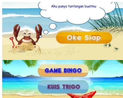
Gambar 5. Tampilan Halaman Perkenalan Menu Kecil

Pemain bebas memilih mana tantangan yang terlebih dahulu akan dihadapi. Setiap tantangan memiliki aturan main. Tampilan aturan main dan tampilan Game Bingo dapat dilihat pada Gambar 6.