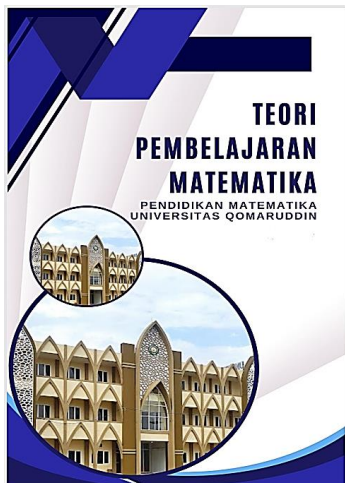
Gambar 1. Tampilan Cover

Pada tahap develop , dilakukan uji validasi bahan ajar mata kuliah Teori Pembelajaran Matematika yang telah disusun. Validasi dilakukan oleh tiga orang validator yang terdiri atas pakar di bidang pendidikan matematika dan pengembangan bahan ajar. Penilaian meliputi aspek kelayakan isi, kebahasaan, penyajian, serta tampilan atau desain. Beberapa tampilan dari produk yang divalidasi tersaji pada Gambar 1 dan 2. Adapun hasil dari seluruh penilaian validator tersaji pada Tabel 6.