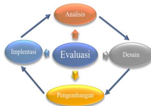
Gambar 1. Tahapan ADDIE

Penelitian ini merupakan jenis penelitian dan pengembangan ( research and development ). Produk yang dihasilkan berupa E-LKPD untuk meningkatkan kemampuan berpikir kritis dan self-confidence peserta didik. Model pengembangan yang digunakan adalah model ADDIE seperti pada Gambar 1.