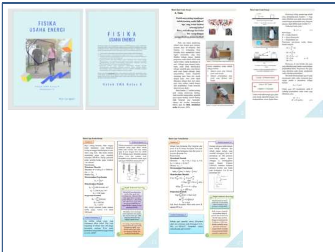
Gambar 1. Media Simulasi Virtual Pembelajaran Materi Suhu dan Kalor

materi ajar yang dikembangkan ditinjau dari aspek validitas, kepraktisan, dan efektivitas. Adapun hasil pengembangan materi ajar yang telah dibuat disajikan pada Gambar 1.