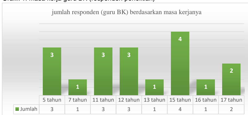
Grafik 1. masa kerja guru BK (responden penelitian)

Grafik tersebut menggambarkan responden penelitian ini memiliki masa kerja yang cenderung lebih banyak di masa kerja 11 tahun ke atas, sedangkan masa kerja yang lebih muda dikarenakan guru tersebut baru diangkat sebagai PNS dan ditempatkan di sekolah yang masih baru beroperasi. Pada umumnya seseorang yang sudah terbiasa dengan suatu pekerjaan akan cepat dan tepat dalam menyelesaikan pekerjaan. Salah satu faktor keberhasilan kinerja guru BK adalah berdasarkan masa kerja yang akan menunjukkan pengalaman kerja guru BK dalam bersikap dan melaksanakan layanan. Lamanya individu bekerja akan memberikan berbagai pengalaman, sehingga individu belajar menumbuhkan dan mengembangkan keterampilannya maupun kesiapannya dalam menyelesaikan masalah. Fitriantoro (2009:18) menjelaskan bahwa masa kerja memiliki pengaruh kualitas kerja karyawan, dikarenakan masa kerja yang lebih lama memberikan karyawan pengalaman dan keterampilan lebih banyak dalam menyelesaikan masalahnya. Sejalan dengan pendapat Fitriantoro, guru BK dengan masa kerja lebih lama diharapkan dapat bekerja lebih baik dibandingkan dengan guru baru bekerja beberapa tahun. Sehingga guru BK senior dapat mengarahkan dan membimbing juniornya dalam bekerja (Lailan Safira Putri Lubis, 2020).