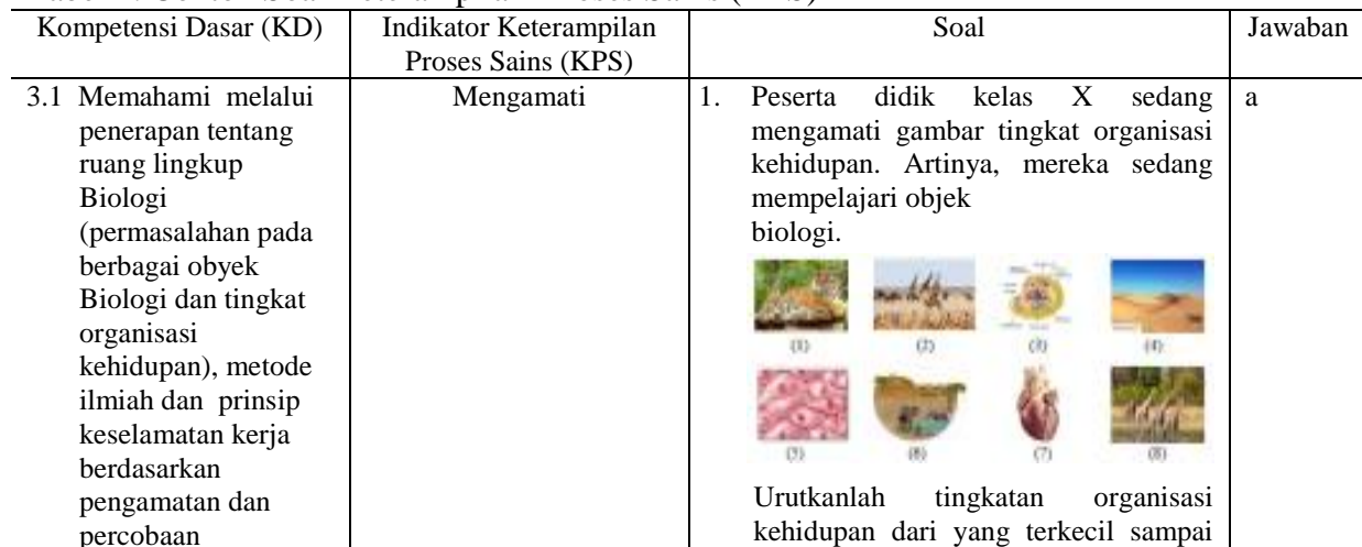
Tabel 4. Contoh Soal Keterampilan Proses Sains (KPS)