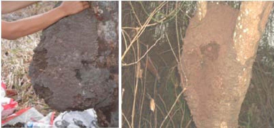
Gambar 3. Dua buah sarang rayap Nasutitermes sp. yang ditemukan pada pohon-pohon di Pulau Sebesi

Dalam hal membentuk sarang di atas pohon, umumnya Nasutitermes lebih memilih tumbuhan berhabitus pohon dan cenderung bersarang pada pohon yang memiliki banyak percabangan. Rayap ini kurang menyukai bersarang di pohon yang tidak memiliki cabang/batang seperti pohon kelapa atau palem. Hal ini diduga karena sarang rayap akan lebih kokoh jika terdapat tumpuan cabang atau batang.