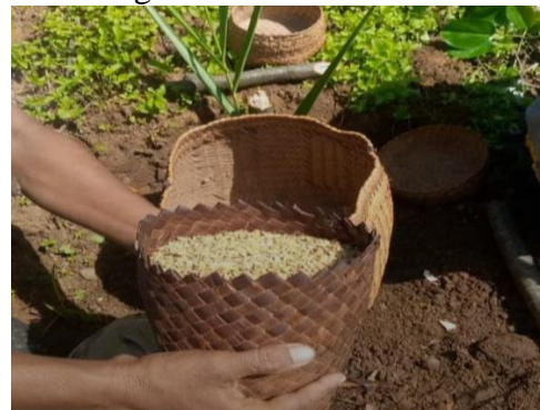
Gambar 2. Acara adat Kede di ladang atau kebun

sementara sisanya tidak boleh dihabiskan dan harus ditinggalkan di dalam tempurungnya. Sisa daging kelapa di dalam tempurung tersebut kemudian ditutup dengan " Denu " (Pohon putri Paulownia tomentosa ) dan " Leke " (daun merbau Azelia xylocarpa ), yang dilingkarkan di " Benga ". Acara terakhir adalah " Ng'ao pu'u pare ," yaitu gerakan membuang ke belakang yang melambangkan bahwa seluruh rangkaian upacara telah selesai dan persiapan menanam sudah siap dilakukan. Untuk penanaman dimulai oleh kepala keluarga atau kepala adat setelah itu di lanjutkan oleh para wanita-wanita dan laki-laki. Setelah itu di tanam padi, jagung dan sayuran lain sampai habis. Adapun larangan-larangan adat dalam porsesi acara adat " Kede " dalam kebun yaitu makan tidak boleh berdiri di kebun, kencing tidak boleh berdiri, Setelah tanam padi besok nya tdk boleh pergi lagi ke kebun tunggu sampai tanaman tersebut tumbuh di ladang atau kebun.