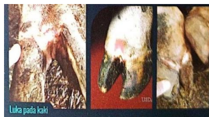
Gambar 3. Luka pada kaki sapi akibat PMK

Penyakit Mulut dan Kuku (PMK) memiliki gejala klinis yang khas dan mudah dikenali pada hewan berkuku belah, seperti sapi, kambing, dan domba. Gejala utama yang tampak adalah demam tinggi mendadak yang dapat mencapai 40 hingga 41°C, disertai pembentukan lepuh (vesikel) di rongga mulut, termasuk lidah, gusi, dan bibir (Department of Agriculture, 2021) Lepuh tersebut akan pecah menjadi luka (lesi) seperti yang sudah dipaparkan pada gambar 1, menyebabkan rasa nyeri sehingga hewan mengalami kesulitan makan dan mengeluarkan air liur berlebihan (hipersalivasi) pada gambar 2. Hipersalivasi berupa air liur berbusa yang keluar terus-menerus dari mulut (Animal & Plant Health Inspection Service, 2021).