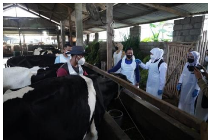
Gambar 4. Kandang komunal sebagai salah satu faktor penyebaran PMK di Kota Batu (Tugu Malang, 2022)

Sebagaimana ditunjukkan pada gambar 4, salah satu faktor utama yang berkontribusi terhadap penyebaran PMK di Kota Batu adalah penggunaan kandang komunal. Lase dkk (2024) menjelaskan bahwa kontaminasi silang di kandang komunal merupakan salah satu jalur utama transmisi virus PMK pada sapi perah di wilayah padat peternakan. Kandang komunal merupakan sistem pemeliharaan di mana beberapa peternak memelihara ternaknya dalam satu lokasi yang sama tanpa sekat individu. Kondisi ini meningkatkan risiko transmisi horizontal antar hewan melalui kontak langsung maupun melalui media yang terkontaminasi, seperti pakan, air minum, dan peralatan kandang. Penularan virus PMK yang sangat cepat melalui droplet dan ekskresi hewan menyebabkan sistem ini sangat rentan terhadap penyebaran penyakit.