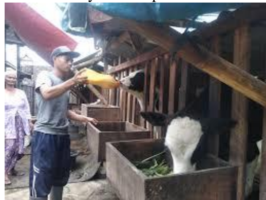
Gambar 5. Praktik biosekuriti yang tidak diterapkan oleh peternak (tidak menggunakan APD).