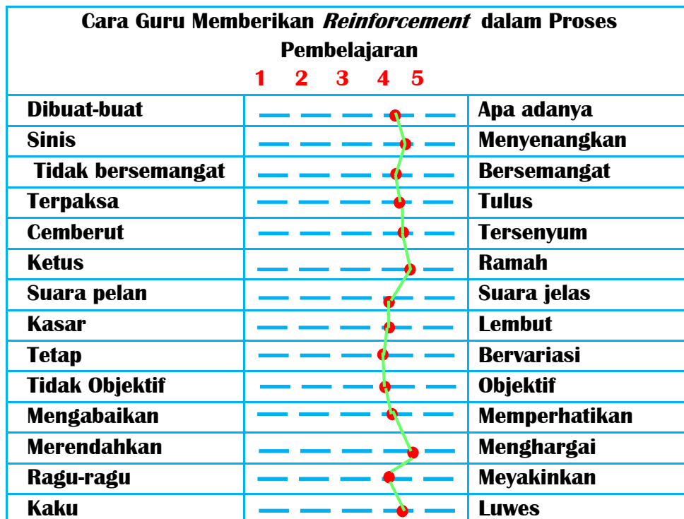
Grafik 3. Cara guru memberikan reinforcement

skor rata-rata cara guru memberikan reinforcement akan disajikan dalam bentuk grafik berikut: